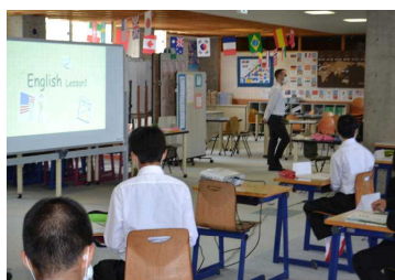
1年1組は学級を2つにして、座席間を確保。教科によっては マイクとスクリーンを使って1フロア全体で授業を展開。