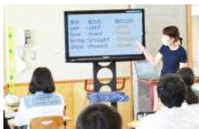
オープンスペースを活用して、 机の間隔を1~2m空けて配置。