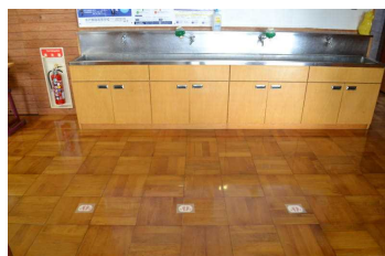
手洗い場やトイレの床には、 ソーシャルディスタンスを示 すマーク。