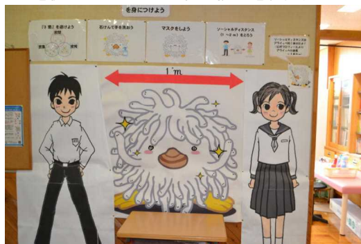
予防のための正しい知識 を身に付けるために、 保健室前には様々な情報 を工夫して掲示。