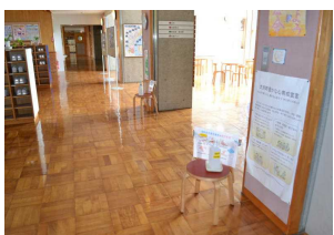
手洗いの徹底。各フロアに 消毒液を常備。