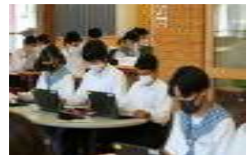
生徒会本部役員と議長団